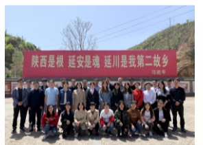
在梁家河参观学习

29日，团员们先后在延安革命纪念馆、杨家岭革命旧址、枣园革命旧址、为人民服务讲站，重温了中国共产党领导人民取得全国革命胜利的光辉历程，深刻体会到无数热血青年以解决民族于水深火热之中为己任，以创造平等、自由、民主、幸福的崭新中国为奋斗目标的伟大精神。在张思德纪念碑前，团员们以朗诵的形式，重新学习了伟大领袖毛泽东重要篇章《为人民服务》和张思德同志为人民服务的精神，深刻理解了个人理想信念和人生追求只有与为人民谋福祉紧密联系在一起，才是伟大的、有意义的。