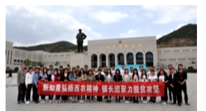
参观延安革命纪念馆

五四爱国运动100周年前夕，校扶贫工作办公室、合阳县委组织部、镇巴县委组织部组织合阳县第三批科技镇长团、镇巴县第二批科技镇长团赴革命圣地延安和梁家河开展“践行五四精神、激扬青春岁月”的主题教育活动，引导科技镇长团成员追寻前辈足迹，接受革命传统教育，感悟习近平总书记七年知青岁月历程，发扬艰苦奋斗精神，坚定理想信念。