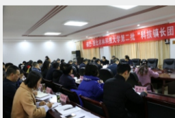
镇巴县第二批科技镇长团交接仪式现场