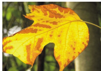
文 / 韩英

一片落叶情 一瞥深情的痕迹 在十月的香腮边 她又留下，浅浅的 那颤抖的秋风里， 谁 生姿的顾盼。 在岸足回瞬间， 带着嗔，含着笑 柔的软的叹息， 又是些， 一瓣瓣的灿烂。 是一些闪耀的字眼， 朵朵轻霜的媚艳。 像是秋洗的一句话， 那一树的金黄， 落叶，