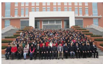
第一届研代会代表合影